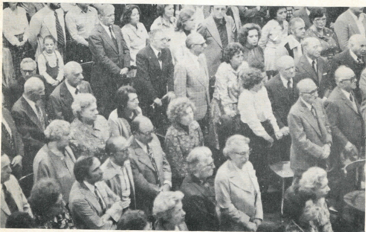
Numeroso público concurrió a los salones del Centro Unión Israelita de Córdoba a festejar la Paz.