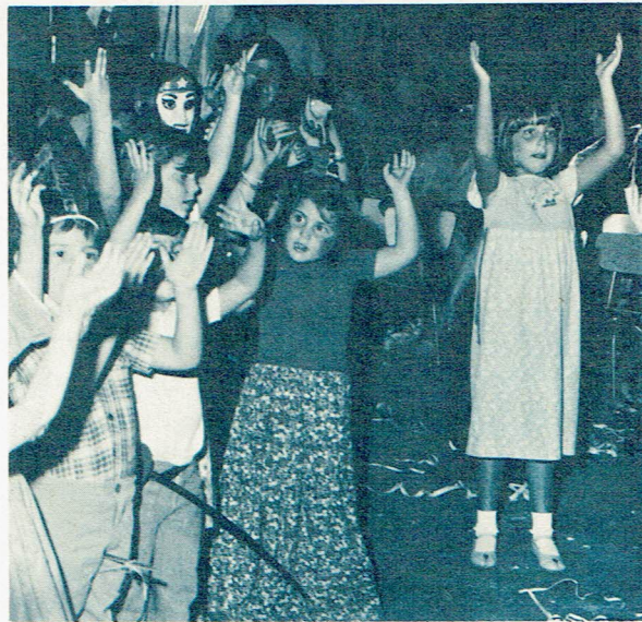
Fiesta de Purim, realizada por los Centros Aviv en el Jardín de Infantes.

PREG.: ¿Los Centros Aviv tienen alguna participación en la regional?