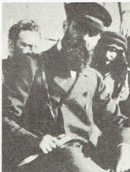
HERZL: en su primer viaje a Eretz Israel.

Herzl no deseaba la instauración de un estado como los demás. De acuerdo a su pensamiento, el Estado judío debía ser un estado modelo basado en los